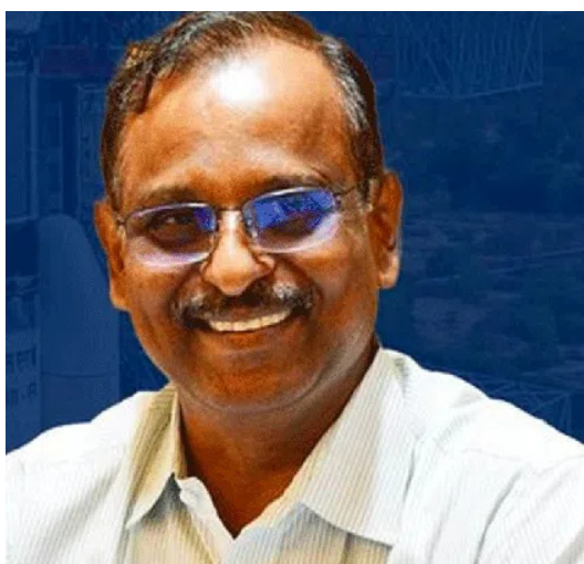
ఇన్ఫో చాలా కీలకమైన మిషన్లను చేపడుతున్నదని, ప్రస్తుతం ఇన్ఫో విజయవంతమైన దశలో వెళ్తుందన్నారు. చేపట్టబోయే ప్రాజెక్టుల గురించి వివరిస్తూ.. స్పేస్ స్టేషన్కు డిసెంబర్ 30వ తేదీన చేపట్టారు, జనవరి 9వ తేదీన స్పేస్

తిరువనంతపురం: ప్రముఖ రాకెట్ శాస్త్రవేత్త వీ నారాయణన్ ఇన్ఫో చీఫ్ గా నియమించిన విషయం తెలిసిందే. ఇన్ఫో చాలా విజయవంతమైన దశలో ఉన్నదని, చంద్రయాన్-4తో పాటు గగన్యాన్ మిషన్ల తమ ముందు ఉన్నట్లు ఆయన తెలిపారు. ఇన్ఫో వైర్లెస్ తో పాటు అంతరిక్ష శాఖ కార్యదర్శిగా నియమితుడైన సందర్భంగా వీ నారాయణన్ సంతోషం వ్యక్తం చేశారు. ఎంతో మంది గొప్ప శాస్త్రవేత్తల నాయకత్వంలో సంస్థ కీర్తిగాంచినందుకు, అలాంటి సంస్థలో పనిచేయడం అదృష్టంగా భావిస్తున్నట్లు ఆయన చెప్పారు. ఇన్ఫో చాలా గొప్ప సంస్థ అని, గతంలో అనేక మంది గొప్ప నేతలు దీన్ని నడిపించారని, ఈ సంస్థలో భాగస్వామ్యం కావడం అదృష్టంగా భావిస్తున్నట్లు తెలిపారు. ఓ ప్రశ్నకు బదులిస్తూ.. తన నియామకం గురించి తొలుత ప్రధాన మంత్రి కార్యాలయం నుంచి ఫోన్ వచ్చినట్లు వీ నారాయణన్ చెప్పారు. ప్రధానియే అన్నీ డిసైడ్ చేస్తున్నారని, పీఎంవో తనను కాంటాక్ట్ అయ్యారని, ప్రస్తుతం ఇన్ఫో వైర్లెస్ ఎన్ సోమనాథ్ కూడా తనకు ఫోన్ కాల్ చేశారని, కొత్త అపాయింట్మెంట్ గురించి చెప్పినట్లు ఆయన వెల్లడించారు. త్వరలో చేపట్టబోయే ఇన్ఫో ప్రాజెక్టుల గురించి మాట్లాడుతూ..