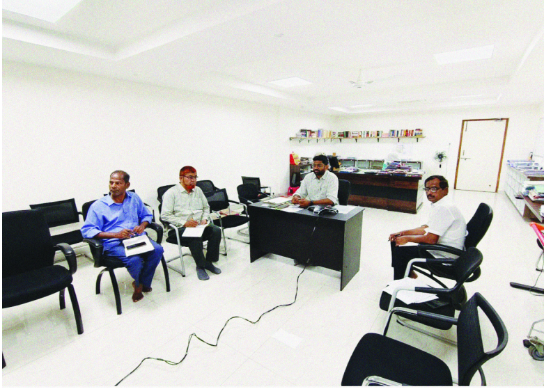
స్వయం సహాయక సంఘాల ద్వారా వెయ్యి మెగావాట్ల ఉత్పత్తి త్వరలో టెండర్లు ఖరారు చేస్తాం ఉప ముఖ్యమంత్రి మల్ల భట్టి విక్రమార్కు

భద్రాద్రి : రాష్ట్రంలో మహిళా సాధికారతే ప్రభుత్వ లక్ష్యమని ప్రజా ప్రభుత్వం విధానపత్రమైన నిర్ణయం తీసుకుంది. దివ్యాంగుల సేవలను గుర్తించి నిర్ధారించడం, భూ సేకరణ, బ్యాంకుల నుంచి ఆర్థిక సాయం వంటి పనులను గ్రామీణ అభివృద్ధి శాఖ, జిల్లా కలెక్టర్లు త్వరితగతిన పూర్తి చేయాలని ఆదేశించారు. ఒక మెగావాట్ల ఉత్పత్తికి నాలుగు ఎకరాలు అవసరం ఉంటుంది. ప్రతి జిల్లాలో 150 ఎకరాలకు తగ్గకుండా రాష్ట్రవ్యాప్తంగా సుమారు నాలుగువేల ఎకరాలు సేకరించాల్సి ఉంటుంది కలెక్టర్లకు తెలిపారు. దేవారా, ఇరిగేషన్ శాఖల పరిధిలోని భూములను గుర్తించాలని, కేంద్ర అటవీ హక్కుల చట్టం ప్రకారం గిరిజనులు భూమి అభివృద్ధి చేసుకునే అవకాశం ఏర్పడిందని తెలిపారు. అటవీ ప్రాంతాల్లో భూములపై హక్కులు ఏర్పడినప్పటికీ స్త్రీలను వేసి విద్యుత్ లైన్ ల ద్వారా విద్యుత్ సౌకర్యం ఏర్పాటు చేసే క్రమంలో అటవీ శాఖ అధికారులతో ఇబ్బందులు తలెత్తుతున్నాయి. ఈ నేపథ్యంలో ఆయా భూముల్లో సోలార్ పవర్ ప్లాంట్లను ఏర్పాటు చేస్తే ఎవరికీ ఇబ్బంది ఉండదని దివ్యాంగుల సేవలను గుర్తించాలని ఆదేశించారు. సోలార్ విద్యుత్తు అందుబాటులోకి వస్తే అటవీ ప్రాంతాల్లోని రైతులు డ్రీమ్ ఇరిగేషన్ ద్వారా పెద్ద ఎత్తున వంటలు సాగు చేసుకునే అవకాశం లభిస్తుందని తెలిపారు. ఈ దిశగా కలెక్టర్లు పనిచేస్తే గిరిజనులు అత్యగ్రహణీయంగా అవకాశం స్పష్టంగా ఉందని తెలిపారు.